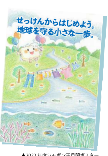
▲2022年度シャボン玉月間ポスター

過去のキャッチコピー 2022年度「せっけんからはじめよう。地球を守る小さな一歩」 2021年度「見直そう！せっけんパワー 変えよう！私と地球の未来」 2020年度「未来へのバトンを繋ぐ、せっけんライフ～守ろう地球、きれいな海～」