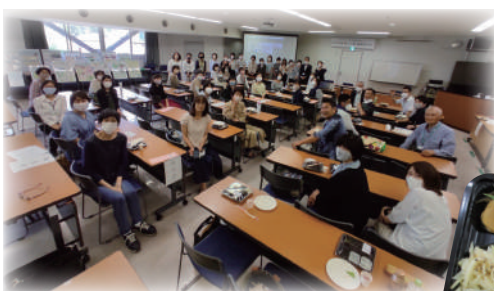
▲通常総代会の参加者のみなさんと