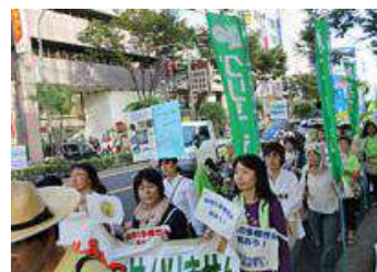
横断幕を持ってパレードするグリーンコープの組合員

現在も「 遺伝子組み換え作物は買わない! 食べない! 作らない! 」を合言葉に反対運動が繰り広げられています。グリーンコープもキャンペーンに連帯しながら運動を展開しています。