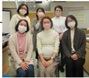
2021年度開催行事 「総代交流会」の写真

新年あけましておめでとうございます。 コロナに対してよくわからない恐怖でいっぱいだった 2020年とは変わり、2021年には感染拡大には気がつけ ながらの活動が徐々にできてきた年でもありました。 おかやまの組合員活動においても、久しぶりの会場での行 事を開催できた地区もあれば、オンラインの利点を生かしての行事を企画したりと、 「今の状況に合わせてできること」を各地区委員会が企画し、開催できたと思います。 また、地区委員会では組合員が気軽に見学できる「オープン開催」の形をとり、グリー ンコープのオススメ試食や試供をしてみたりと、新しい試みにも着手できました。 各地区の詳しい様子については、毎月開催されている地区委員会や、2月中旬～3月 初旬にかけて開催される「地区組合員総会」にて聞いてみてくださいね！ 2022年も「活動組合員が知りたい事・やりたい事を楽しみながら企画できる」そんな 地区活動ができるように、またより多くの組合員に活動の内容を知ってもらい、興味 を持ってもらえるように合同委員会メンバーで盛り上げて行けたらと思います。