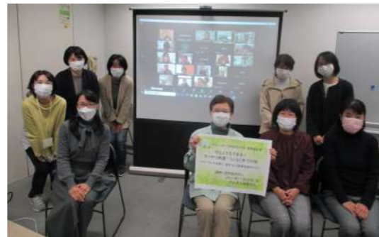
2021年度開催行事「片づけ術」の写真

2021年は、遠方への往来が制限され、帰省もままならない中で、人 とつながることの大切さに気づく一年になりました。 県外に出ることはできませんでしたが、福祉委員会や100円基金の 取り組みを通じて、岡山で活躍するたくさんの方々を知り合う機会 を得、福祉県岡山の底力を感じることができました。 2022年は様々な活動をされている方々と知り合い、つながり、楽し いことや嬉しいことを広げていく一年にしたいと考えています。本 年もよろしくお願いいたします。