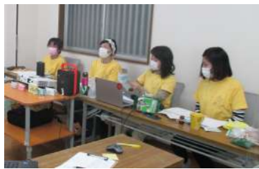
2021年度開催行事 「グリーンコープカフェ」スタッフ写真

平和・環境委員会では、せっけんや4R、でんきなど環境の取 り組みや、平和や民衆交易、食の安全など、暮らしで大切にし たいアレコレをお喋りしながら、その思いをカタチにしてい ます。 “いのちを大切にしたい” “みどりの地球をみどりのままで未 来の子どもたちに手渡したい” という組合員の願いが広がり、 そして地域に根差すよう活動していきます。