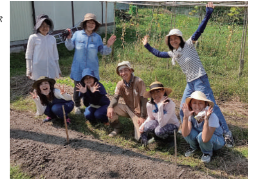
支援委員会はまび畑プロジェクトとして自然農法で野菜も作っています