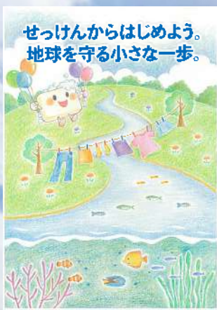
▲2022年度シャボン玉月間ポスター